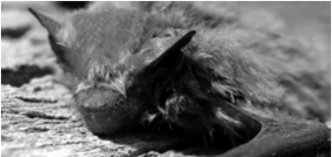
Die Zwergfledermaus ist die häufigste Fledermaus in Bonn.