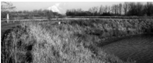
Die ehemaligen Klärteiche bei Bedburg stehen seit 2002 unter Naturschutz.