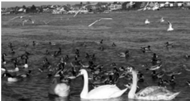
Ansammlung von Wasservögeln am Fähranleger in Mondorf.