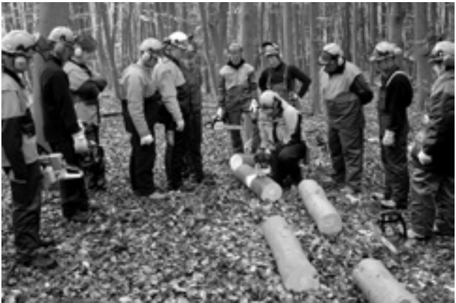
Aufbereitung von Stammholz.