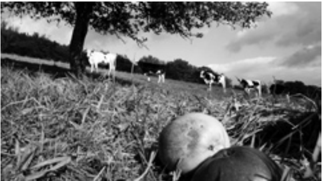
Traditionelles Obstgrünland im Herbst.