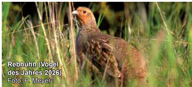
Rebhuhn (Vogel des Jahres 2026)

5 €, für Familien 10 €. Anmeldung erforderlich unter www.biostation-bonn-rheinerft.de/events . Feste Schuhe empfohlen.