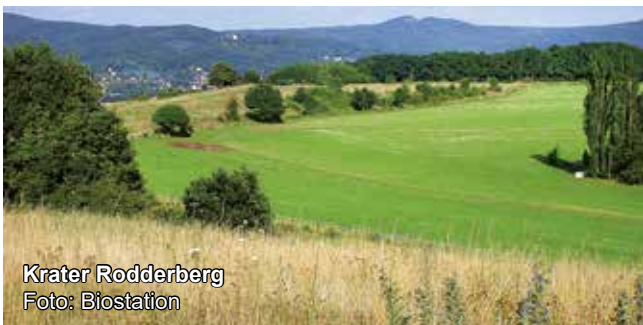
Krater Rodderberg